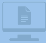
کورس‌های پیشنهادی آفلاین