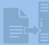
بارگزاری فیش‌ها در سرور