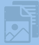
بانک تست‌های کنکور فرانسه