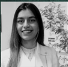
Afsa Region Lead