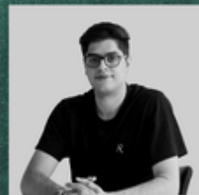
Nima R IT Team