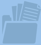
دروس کامل آموزشی سال‌های گذشته